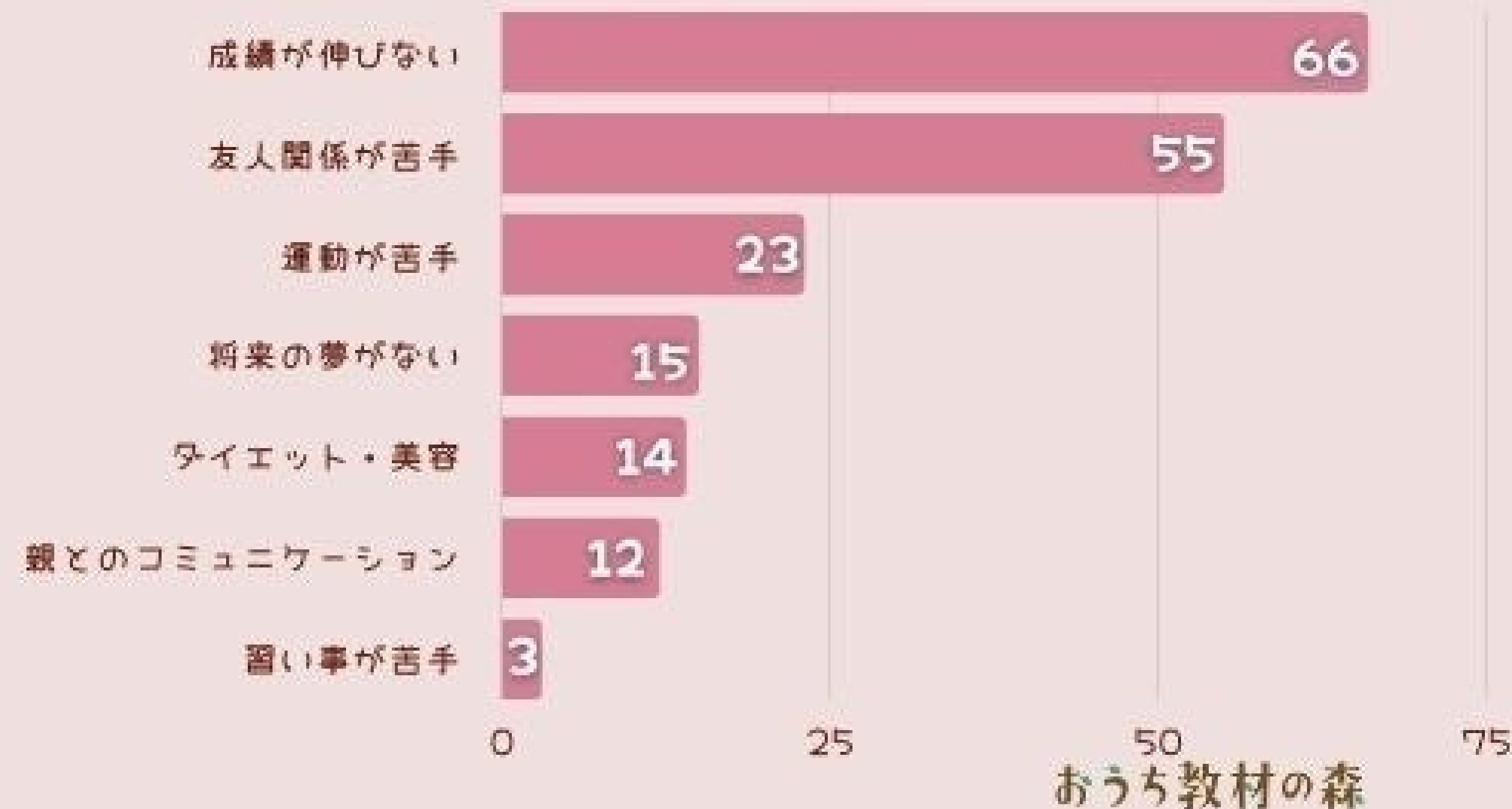
中学生の子どもが悩んでいることは？ (回答数=188人)